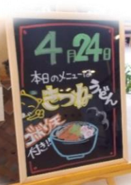
生活リハビリの様子